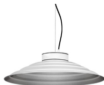
2: RAL9005 Negre Fosc texturat 50: Platejat