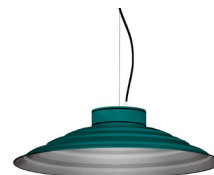
20: RAL 6000 Verd Pàtina texturat 50: Platejat