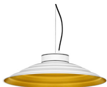
1: RAL9010 Blanc Pur texturat 30: Daurat