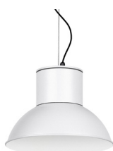
01: RAL9010 Blanc Pur texturat