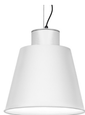
01: RAL9010 Blanc Pur texturat