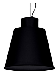
02: RAL9005 Negre Fosc texturat