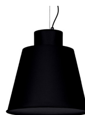
02: RAL 9005 Negre Fosc texturat