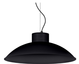
02: RAL9005 Negre Fosc texturat