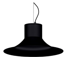
02: RAL9005 Negre Fosc texturat