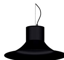
02: RAL9005 Negre Fosc texturat