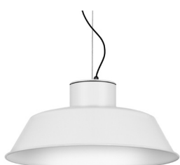
01: RAL9010 Blanc Pur texturat