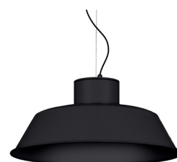
02: RAL9005 Negre Fosc texturat