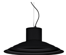
02: RAL9005 Negre Fosc texturat