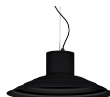
02: RAL9005 Negre Fosc texturat