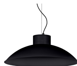
02: RAL9005 Negre Fosc texturat