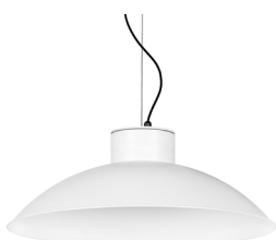
01: RAL9010 Blanc Pur texturat