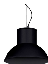
02: RAL9005 Negre Fosc texturat