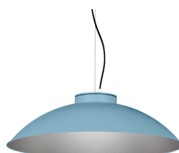
17: RAL 5024 Blau Pastel texturat 50: Platejat