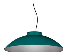
20: RAL 6000 Verd Pàtina texturat 50: Platejat