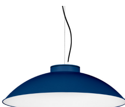
18: RAL 5003 Blau Safir texturat 10: RAL9010 Blanc Pur texturat