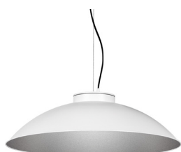
2: RAL9005 Negre Fosc texturat 50: Platejat