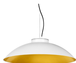
1: RAL9010 Blanc Pur texturat 30: Daurat