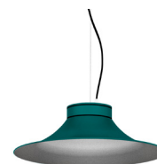
20: RAL 6000 Verd Pàtina texturat 50: Platejat