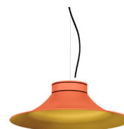
15: RAL 2012 Taronja Salmó texturat 30: Daurat