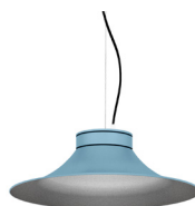
17: RAL 5024 Blau Pastel texturat 50: Platejat