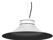
20: RAL9005 Negre Fosc texturat