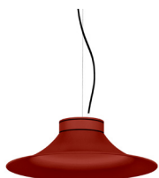
16: RAL 3000 Vermell Viu texturat