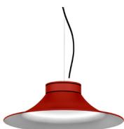
16: RAL 3000 Vermell Viu texturat 10: RAL9010 Blanc Pur texturat