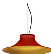
16: RAL 3000 Vermell Viu texturat 30: Daurat