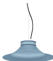
17: RAL 5024 Blau Pastel texturat