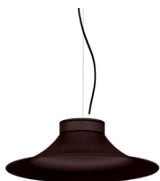
22: RAL8016 Caoba texturat