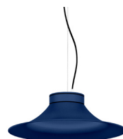
18: RAL 5003 Blau Safir texturat