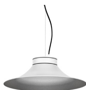
2: RAL9005 Negre Fosc texturat 50: Platejat