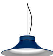
18: RAL 5003 Blau Safir texturat 10: RAL9010 Blanc Pur texturat