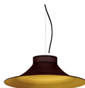
22: RAL8016 Caoba texturat 30: Daurat