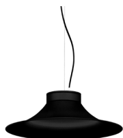
2: RAL9005 Negre Fosc texturat