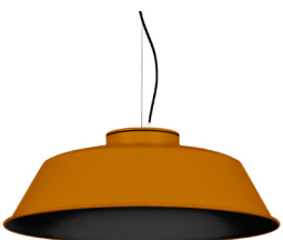
21: RAL 8001: Marró Ocre texturat 20: RAL9005 Negre Fosc texturat