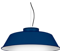
18: RAL 5003 Blau Safir texturat 10: RAL9010 Blanc Pur texturat