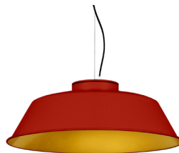
16: RAL 3000 Vermell Viu texturat 30: Daurat