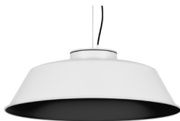
20: RAL9005 Negre Fosc texturat