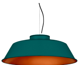
20: RAL 6000 Verd Pàtina texturat 40: Coure