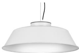
10: RAL9010 Blanc Pur texturat