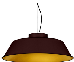
22: RAL8016 Caoba texturat 30: Daurat