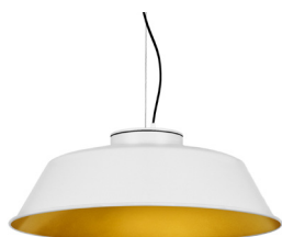
1: RAL9010 Blanc Pur texturat 30: Daurat