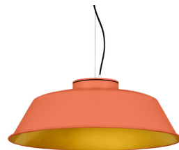
15: RAL 2012 Taronja Salmó texturat 30: Daurat