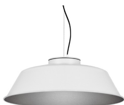
2: RAL9005 Negre Fosc texturat 50: Platejat