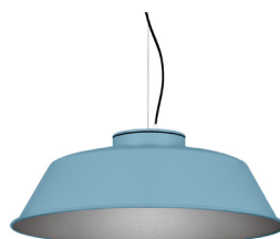
17: RAL 5024 Blau Pastel texturat 50: Platejat