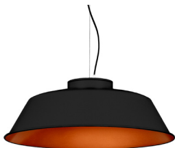
2: RAL9005 Negre Fosc texturat 40: Coure