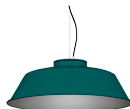
20: RAL 6000 Verd Pàtina texturat 50: Platejat