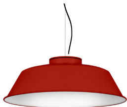
16: RAL 3000 Vermell Viu texturat 10: RAL9010 Blanc Pur texturat