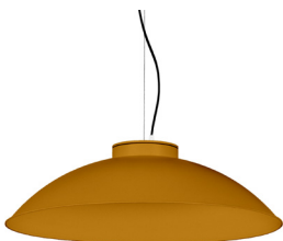
21: RAL 8001: Marró Ocre texturat