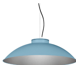
17: RAL 5024 Blau Pastel texturat 50: Platejat