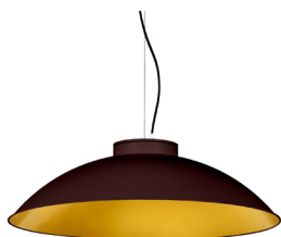
22: RAL8016 Caoba texturat 30: Daurat