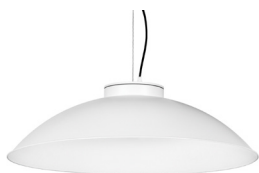
10: RAL9010 Blanc Pur texturat