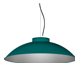
20: RAL 6000 Verd Pàtina texturat 50: Platejat