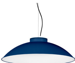
18: RAL 5003 Blau Safir texturat 10: RAL9010 Blanc Pur texturat