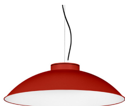
16: RAL 3000 Vermell Viu texturat 10: RAL9010 Blanc Pur texturat