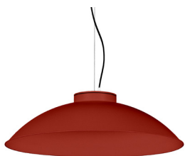
16: RAL 3000 Vermell Viu texturat