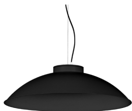
2: RAL9005 Negre Fosc texturat