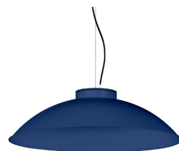
18: RAL 5003 Blau Safir texturat