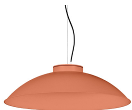
15: RAL 2012 Taronja Salmó texturat