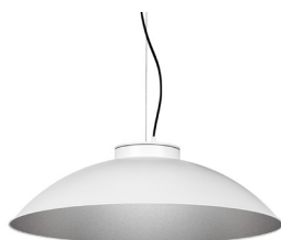
2: RAL9005 Negre Fosc texturat 50: Platejat