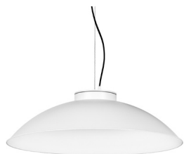
1: RAL9010 Blanc Pur texturat