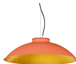
15: RAL 2012 Taronja Salmó texturat 30: Daurat