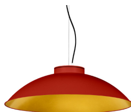
16: RAL 3000 Vermell Viu texturat 30: Daurat