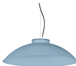
17: RAL 5024 Blau Pastel texturat