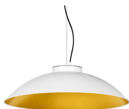
1: RAL9010 Blanc Pur texturat 30: Daurat