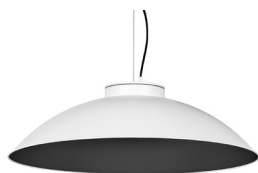
20: RAL9005 Negre Fosc texturat