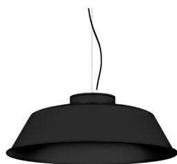
2: RAL9005 Negre Fosc texturat