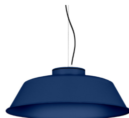
18: RAL 5003 Blau Safir texturat