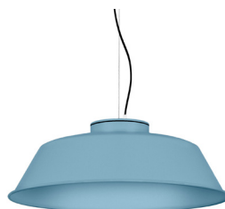
17: RAL 5024 Blau Pastel texturat