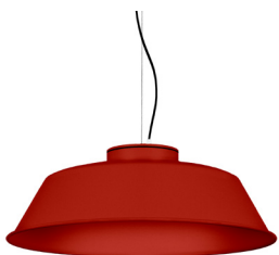
16: RAL 3000 Vermell Viu texturat