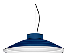
18: RAL 5003 Blau Safir texturat 10: RAL9010 Blanc Pur texturat