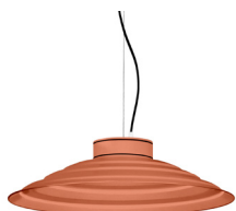
15: RAL 2012 Taronja Salmó texturat