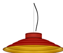
16: RAL 3000 Vermell Viu texturat 30: Daurat