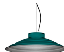
20: RAL 6000 Verd Pàtina texturat 50: Platejat