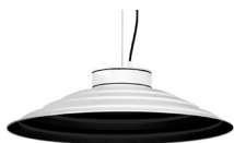
20: RAL9005 Negre Fosc texturat