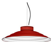
16: RAL 3000 Vermell Viu texturat 10: RAL9010 Blanc Pur texturat