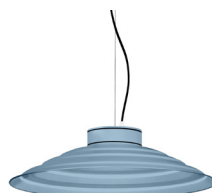
17: RAL 5024 Blau Pastel texturat