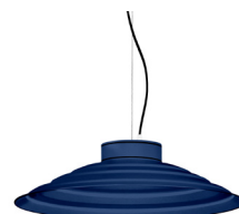
18: RAL 5003 Blau Safir texturat