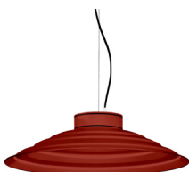
16: RAL 3000 Vermell Viu texturat