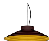
22: RAL8016 Caoba texturat 30: Daurat