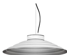
2: RAL9005 Negre Fosc texturat 50: Platejat