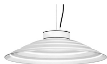
10: RAL9010 Blanc Pur texturat