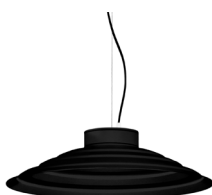
2: RAL9005 Negre Fosc texturat