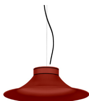
16: RAL 3000 Vermell Viu texturat