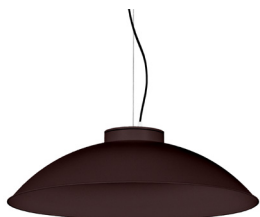
22: RAL8016 Caoba texturat