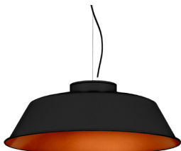
2: RAL9005 Negre Fosc texturat 40: Coure