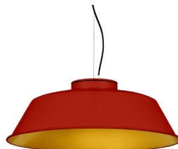
16: RAL 3000 Vermell Viu texturat 30: Daurat