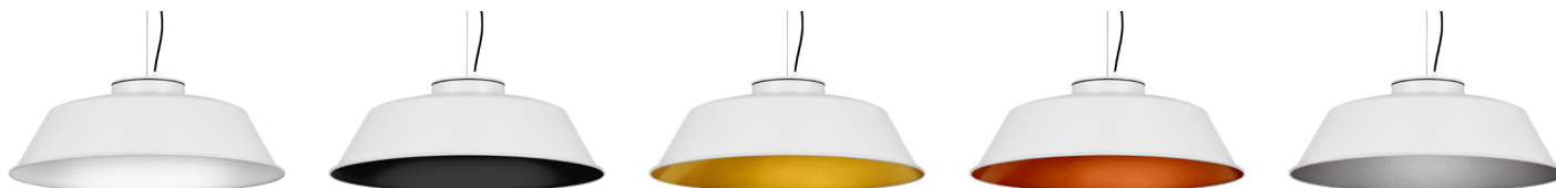
10: RAL 9010 Reinweiß