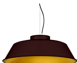
22: RAL 8016 Mahagonibraun 30: Golden