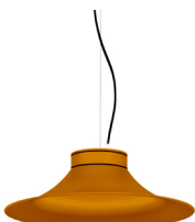
21: RAL 8001: Ockerbraun