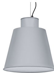
07: RAL 9006 Weißszlig;aluminium