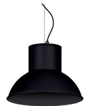
02: RAL 9005 Tiefschwarz