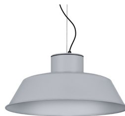
07: RAL 9006 Weißszlig;aluminium