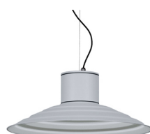
07: RAL 9006 Weißszlig;aluminium