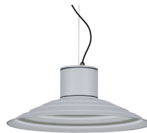
07: RAL 9006 Weißszlig;aluminium