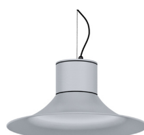
07: RAL 9006 Weißszlig;aluminium