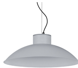
07: RAL 9006 Weißszlig;aluminium