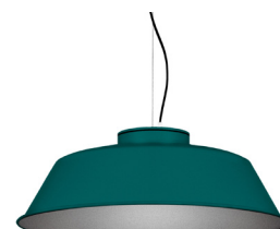
20: RAL 6000 Patinagrün 50: Silber