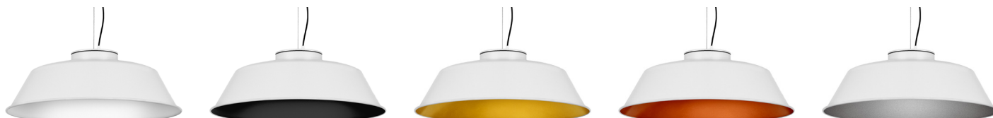
10: RAL 9010 Reinweiß