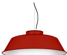
16: RAL 3000 Feuerrot 10: RAL 9010 Reinweiß