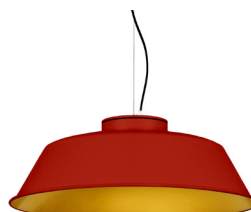
16: RAL 3000 Feuerrot 30: Golden