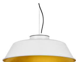
1: RAL 9010 Reinweiß 30: Golden