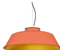
15: RAL 2012 Lachsorange 30: Golden