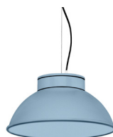
17: RAL 5024 Pastellblau