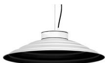
20: RAL 9005 Tiefschwarz textured