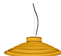
14: RAL 1037 Sonnengelb