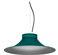
20: RAL 6000 Patinagrün 50: Silber