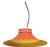
15: RAL 2012 Lachsorange 30: Golden