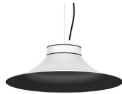
20: RAL 9005 Tiefschwarz textured