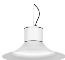
01: RAL9010 Blanco Puro texturado