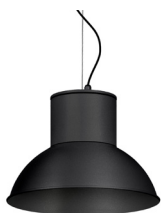
04: RAL 7016 Gris Antracita texturado