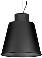
04: RAL 7016 Gris Antracita texturado