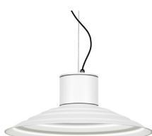
01: RAL9010 Blanco Puro texturado