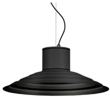
04: RAL 7016 Gris Antracita texturado