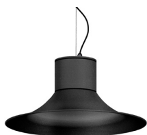
04: RAL 7016 Gris Antracita texturado