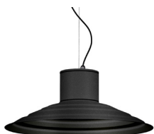
04: RAL 7016 Gris Antracita texturado