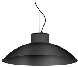
04: RAL 7016 Gris Antracita texturado