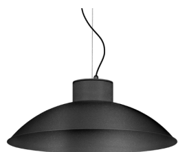
04: RAL 7016 Gris Antracita texturado