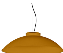
21: RAL 8001: Pardo Ocre texturado