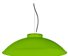
19: RAL 6018 Verde Amarillento texturado