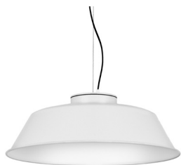
1: RAL9010 Blanco Puro texturado